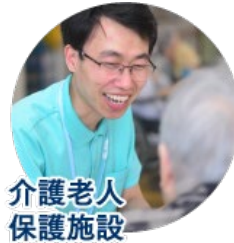
介護老人 保護施設