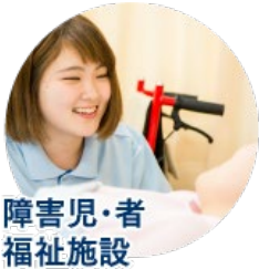
障害児・者 福祉施設