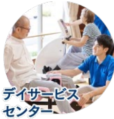
デイサービス センター